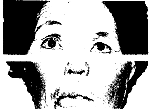
Photo. 6. These two films reveal Bell's palsy on the left face.

환자의 고혈압은 적절한 혈압강하제로 조절이 되었고 뇌부종 가능성에 대하여 Glycerol를, 뇌경색의