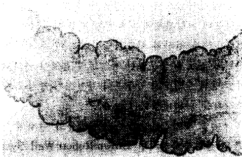
Fig. 2. The microscopic findings of Sparganum.

을 이용하여 우측 전두부에 국소 마취를 한 후, 두피 절개를 하고, Burr hole을 뚫어 biopsy needle을 넣어서 4cm 깊이에서 2cm×0.2cm의 실같이 길고 가느다란 회백색 유충을 적출하였다. 기생충학적 특징은 calcarous corpuscles이 있고 transverse septation이 없는 전형적인 sparganum의 소견을 보여 주고 있었다 (Fig 2).