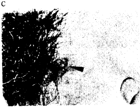
Photo. 1. A. Alternating external strabismus on left eye, showing incipient cataract on both eyes. B. Painful oral aphthae on the tip of tongue. C. Labial aphthous ulcer.