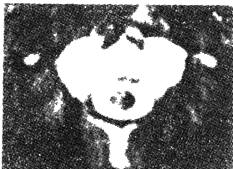
Fig. 2. Metrizamide spine CT shows moderate increased density within the spinal canal of C2.